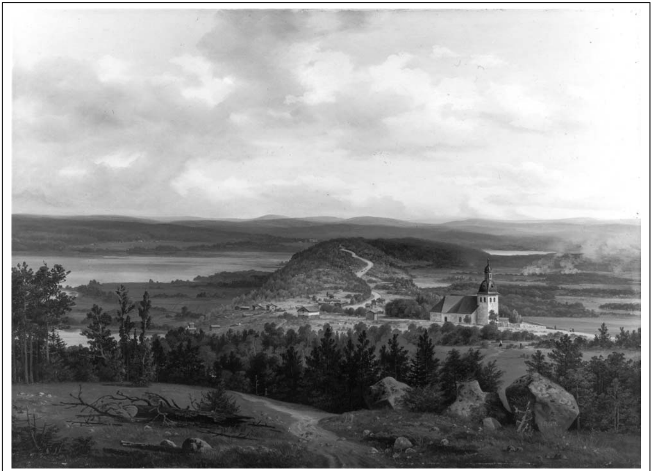
Kuohunharju Kirkkoharjulta nähtynä

Von Wright 1862 / Museovirasto Kangasala-seura