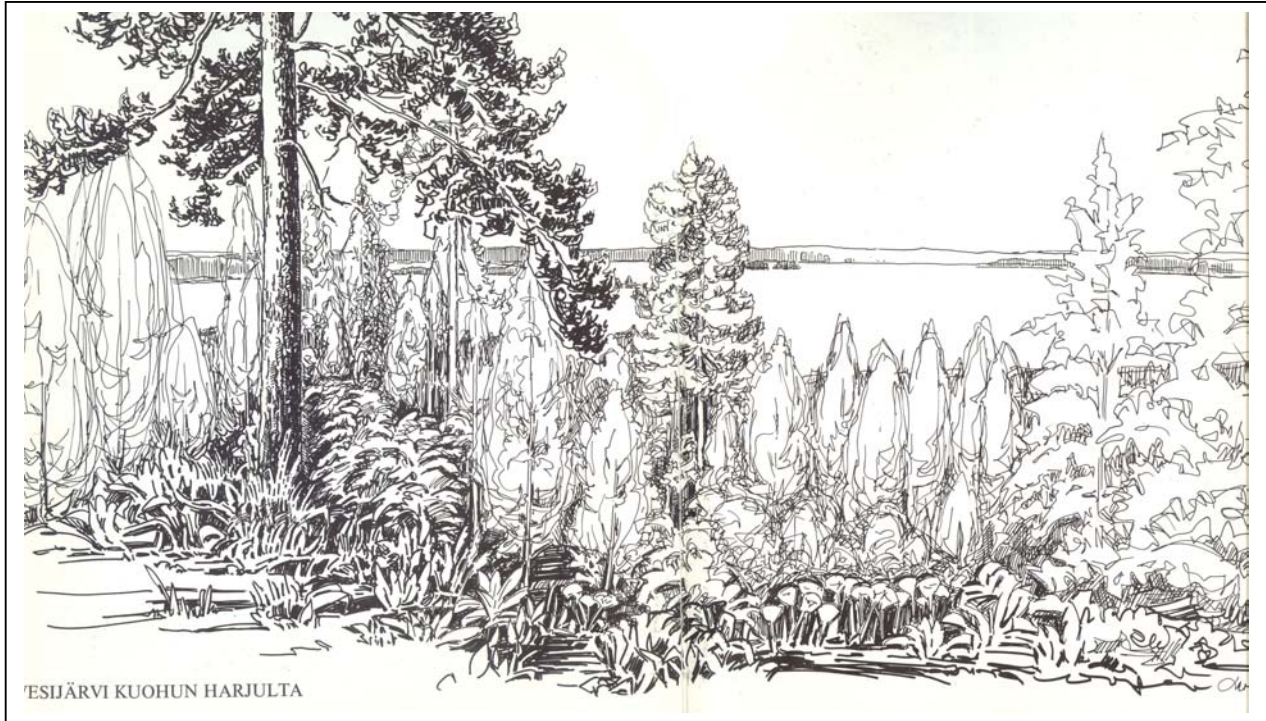
VESIJÄRVI KUOHUN HARJULTA

Vesijärvi Kuohunharjun levähdyspaikalta nähtynä, vuodelta 1979 (piirtäjä nimikirjoituksesta tuntematon)