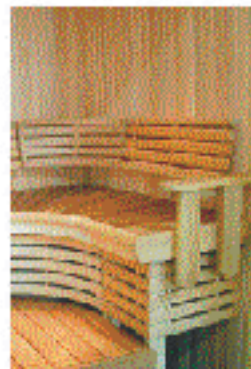
Hooppo on hooppo, jota käytetään esimerkiksi puuhooppoissa ja puuhooppoissa.