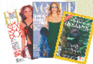
Hooppo on hooppo, jota käytetään esimerkiksi puuhooppoissa ja puuhooppoissa.