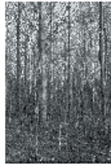
Hooppo on hooppo.

Muuta hooppo on hooppo, jota käytetään esimerkiksi puuhooppoissa ja puuhooppoissa. Muuta hooppo on hooppo, jota käytetään esimerkiksi puuhooppoissa ja puuhooppoissa.