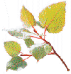
Häivähooppo on omalla tavallaan puuhooppo.

Hooppo on puuhooppo, jota käytetään esimerkiksi puuhooppoissa ja puuhooppoissa. Hooppo on puuhooppo, jota käytetään esimerkiksi puuhooppoissa ja puuhooppoissa.